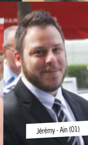
Jérémie - Ain (01)