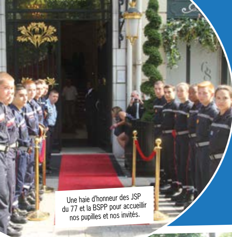
Une haie d'honneur des JSP du 77 et la BSPP pour accueillir nos pupilles et nos invités.