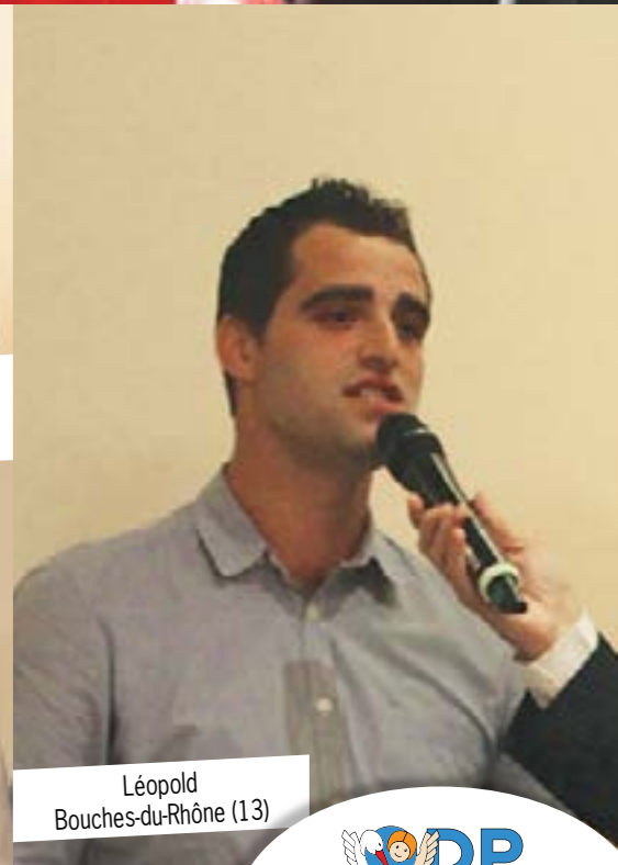
Léopold Bouches-du-Rhône (13)