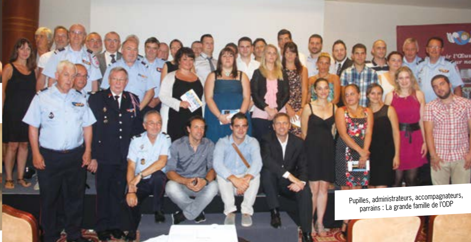
Pupilles, administrateurs, accompagnateurs, parrains : La grande famille de l'ODP