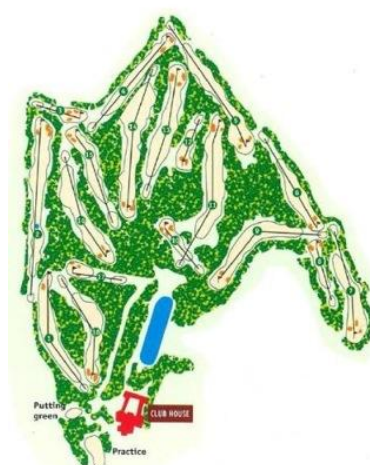
PLAN DU PARCOURS

Création et réalisation : CIGAF Publ' Diffusion 136, rue du Marais - 73100 Aix-les-Bains - Tél. 04 79 35 52 69